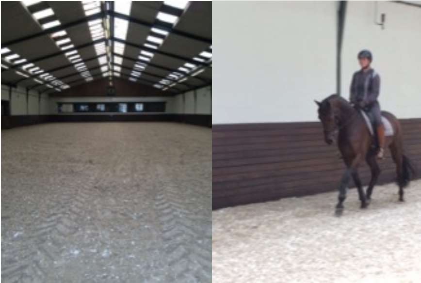
Inwijding met de eerste drol van Flappie